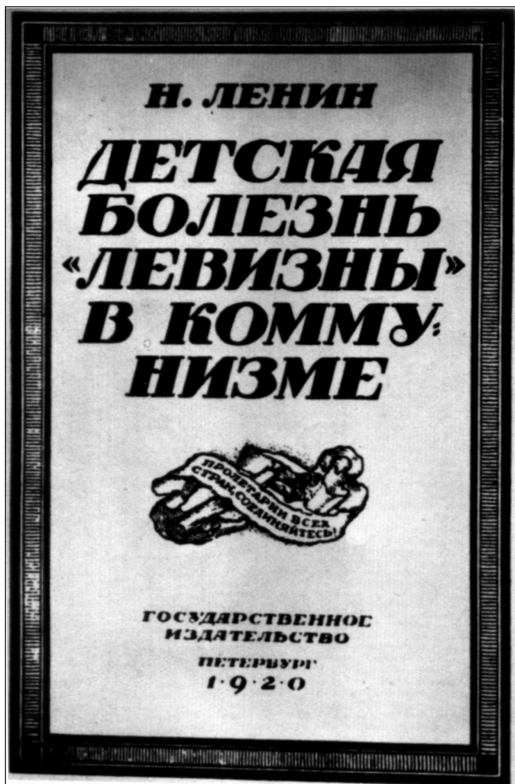
Portada de la primera edición en ruso (1920) de La enfermedad infantil del 'Izquierdismo' en el comunismo.